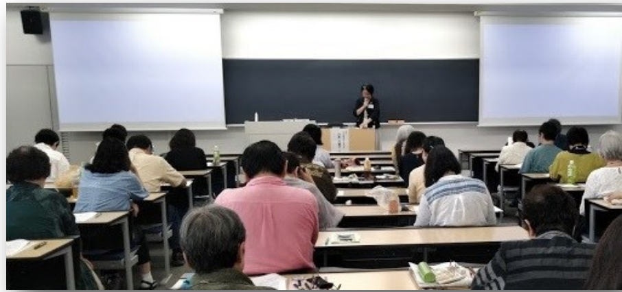
(写真 2019年9月女性労働セミナーの様子)

研究会は、いつの時代もその時々の女性労働問題に根ざした研究を展開し、理論と実践の両面でその解決に貢献してきました。