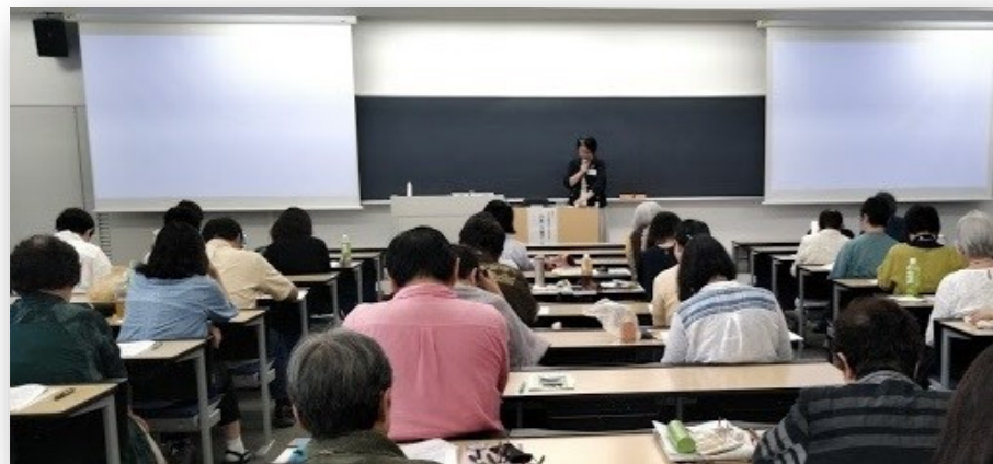
(写真 2019年9月女性労働セミナーの様子)

研究会は、いつの時代もその時々の女性労働問題に根ざした研究を展開し、理論と実践の両面でその解決に貢献してきました。